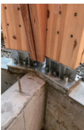
柱にかかる引抜き力に耐えるため、より強固な金物を。