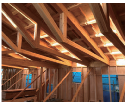
三角形を単位として構成された構造形式。木造でも長距離のスパンをとばせるため、大空間が可能。