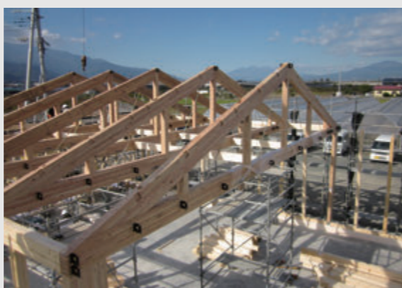
長谷川空手道場「英心館」(山梨県) 竣工日: 2020年3月 11mを超える大開口に対し、出来る限り一般市場材のみで組み立てられるよう考えられたトラス梁。トラスの斜め部分の面倒な施工をボルトにすることで施工性もUP。