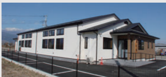
すべて現場組み立てにすることで納品車両も特注にしないで配送可能。