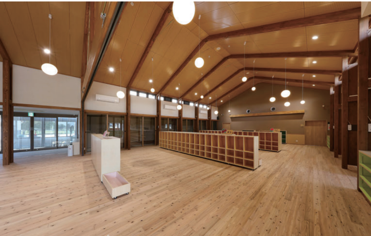
八幡保育園（福岡県）

枡徳は、非住宅の木造化をおすすめし、サポートも行っております。 オーナー様・社会へのメリットはもちろん、工務店様にもメリットがあると考えます。 今号では、地域の非住宅を木造化することについて、ご紹介いたします。