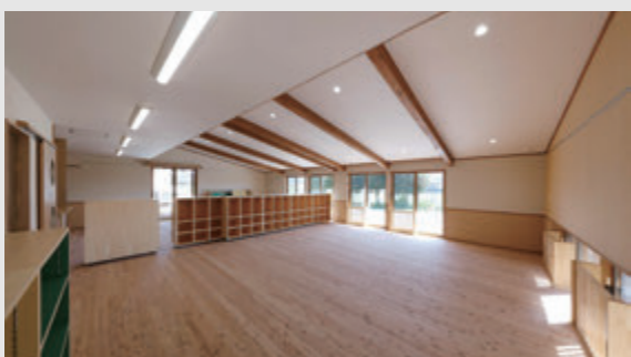
特殊な合掌梁で大空間を実現。