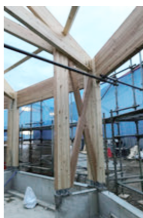
高倍率の耐力壁を用いることで開放性を確保。