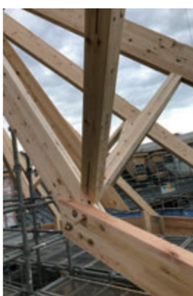
屋根の荷重をバランス良く外部へ分散。