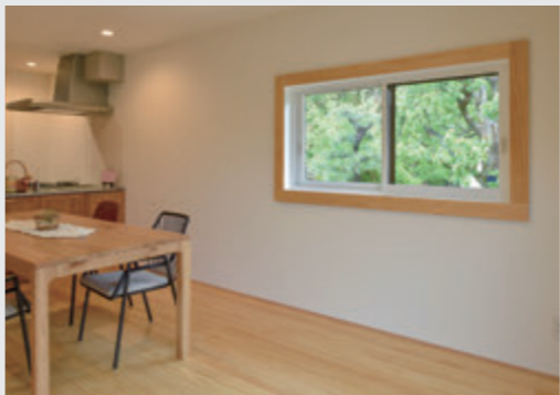
窓額縁が印象的な窓