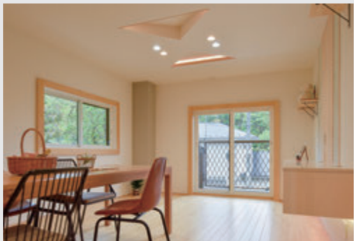
自然の光で明るいお部屋に

・友人を呼べる家になりました! 「オシャレで素敵なお家!」と言ってくれて、とても嬉しかったです。(奥様) ・以前は、狭いということもあって家族が同じ空間にいたことが少なかったのですが、部屋が広がって家族が自然と集まるが増えました。(娘さん)