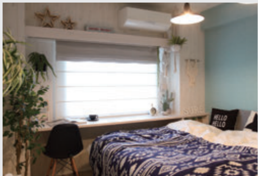
シェードを下ろすと映画も楽しめるスクリーンに

新築マンション物件の寝室の窓辺をプチリノベーション。奥様の趣味がDIYなので以前からインテリアにはご興味があったそう。新たに取ったカーテンボックスには、奥様こだわりの小物やグリーンがたくさん並び、そこに居るだけで嬉しい空間になっていますね。