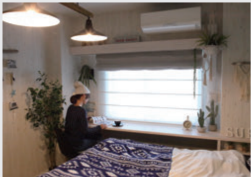
窓辺のデスクはmadolinoではwindeskと呼ぶ

こちらも新たに取ったというカウンタースクは、現在奥様のパソコン作業や読書の場所となっていますが、お子様2人が大きくなったら学習机として使うことを考えているそう。ご家族のライフイベントの変化とともに、使い方も成長する窓辺となっていますね。