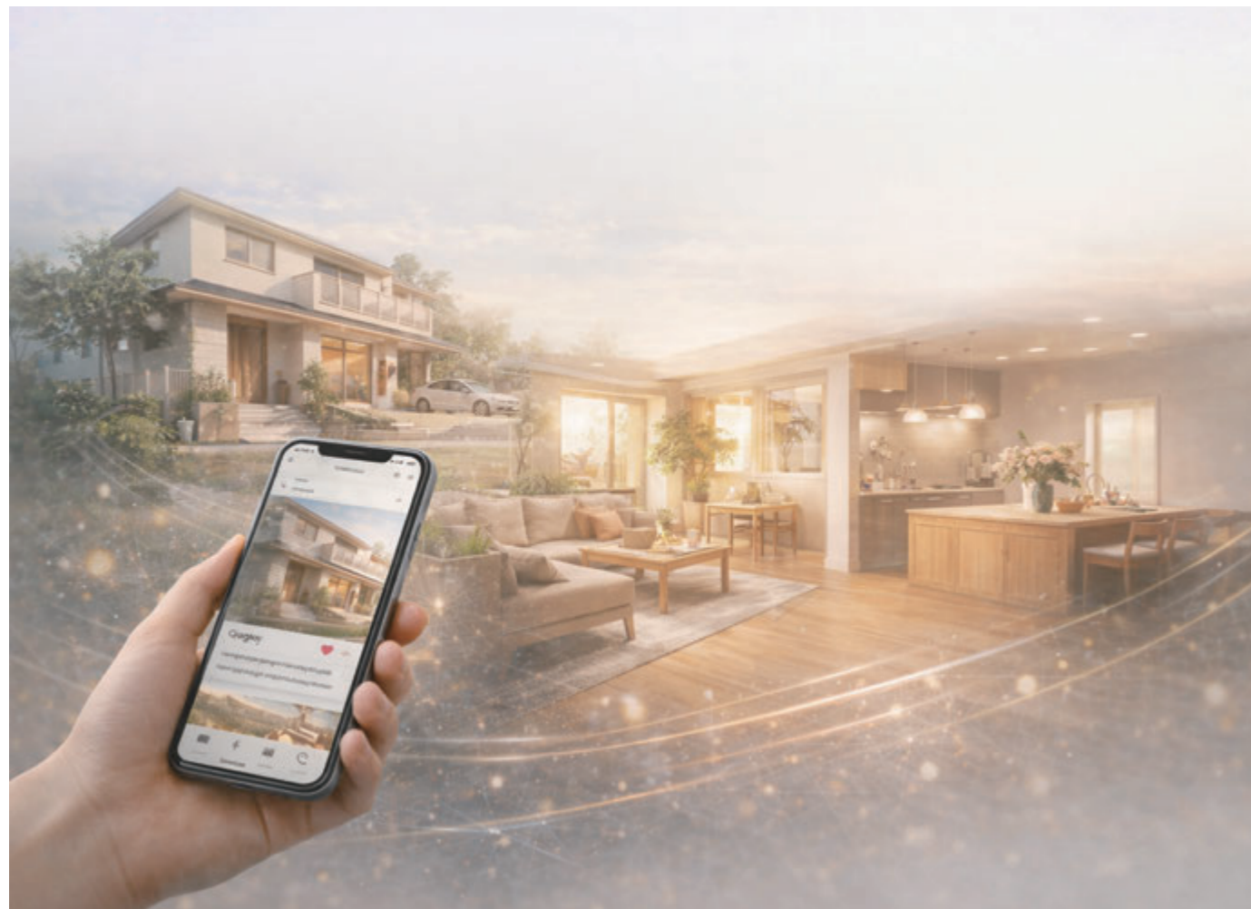
※こちらの表紙画像はAIで生成しました。

人口減少や建築費の高騰など、住宅を取り巻く環境は大きな転換期を迎えています。家を建てて売っただけでは選ばれにくい時代。機能だけでなく、「なぜその家を作るのか」という “自社らしさ=世界観” が問われています。今回は、「こちらで家を建てたい」とお施主様に選ばれるためのSNS発信のヒントをご紹介します。AIを活用することで、投稿にかかる時間や人手不足を補い、効率よく情報を届けることができます。ぜひ中面にてご覧ください。