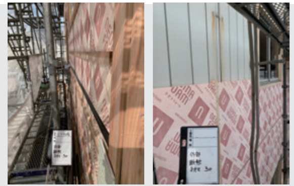
工場の稼働をストップさせずにネオマフォームを施工