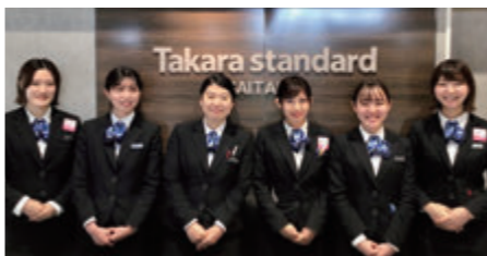
さいたまショールーム アドバイザーの皆様