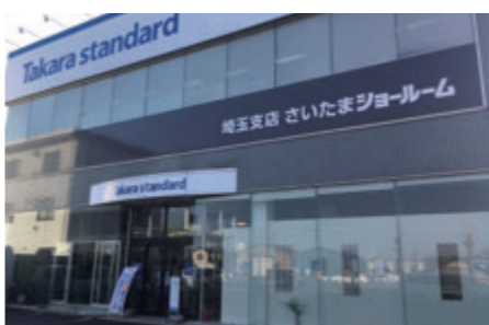
埼玉支店 さいたまショールーム 外観